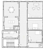
OG 11 200