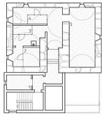
OG 11 200