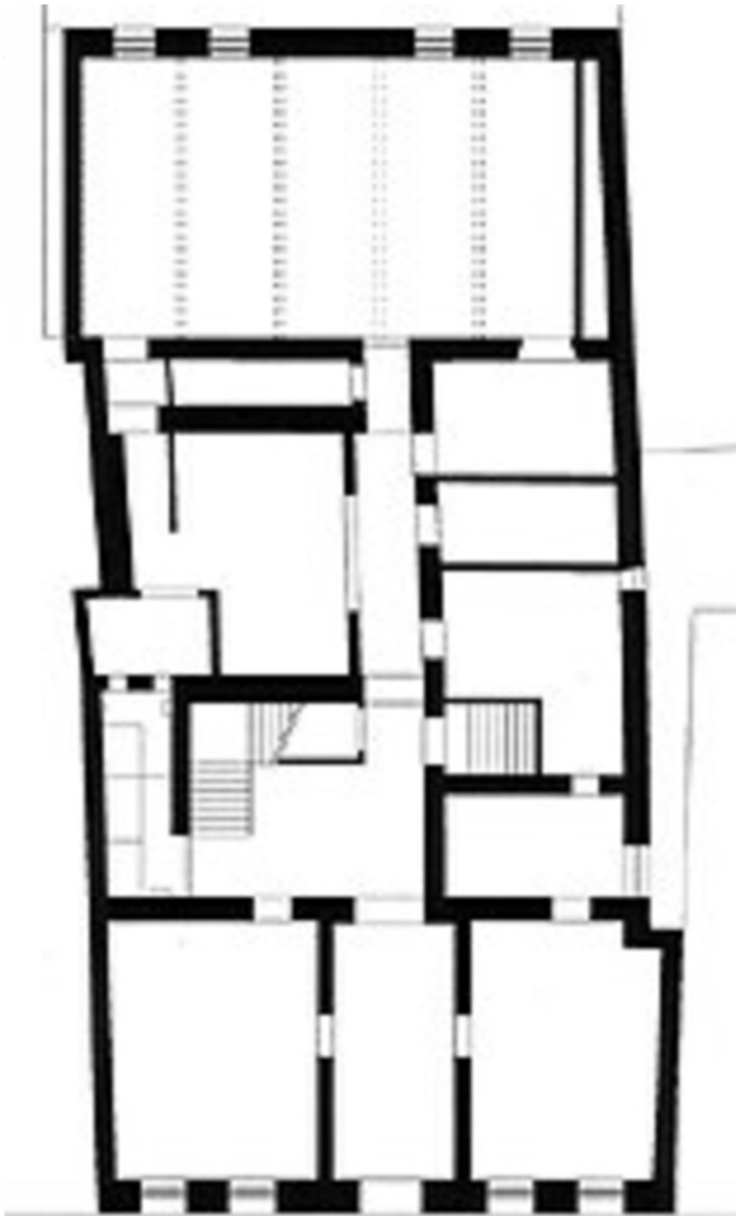
Grundriss (vor Umbau)